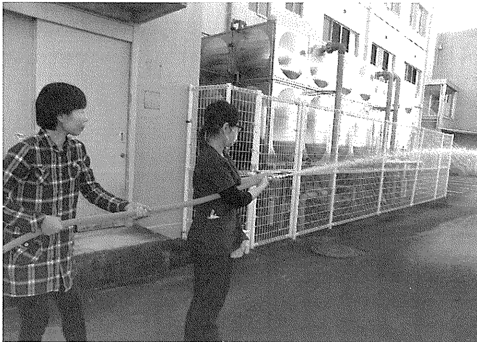
補助散水機による消火訓練

今回の訓練で、患者さんの安全の為に普段から避難経路や消火道具の位置・点検が大切だと学びました。